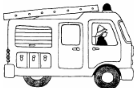
u camiò di i spenghjì fochi